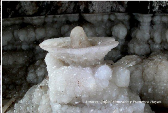
Sala de la Palmatoria